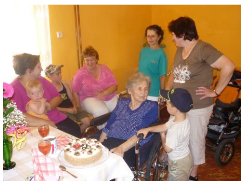
Narozeniny srpen 2011

Každý měsíc je organizována oslava klientů v jídelně Domova, kteří mají daný měsíc narozeniny. Na tuto oslavu si klienti mohou pozvat, koho chtějí. Většinou jsou zváni členové rodin klientů, pokud si to klient přeje.