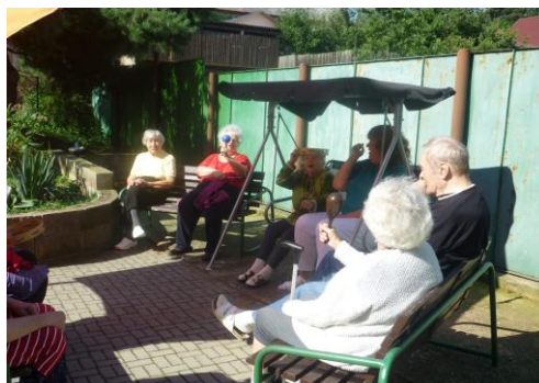
Venkovní posezení s hudebními nástroji

Každý měsíc je organizována oslava klientů v jídelně Domova, kteří mají daný měsíc narozeniny. Na tuto oslavu si klienti mohou pozvat, koho chtějí. Většinou jsou zváni členové rodin klientů, pokud si to klient přeje.