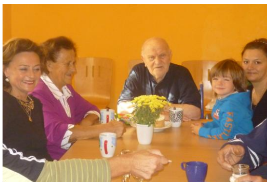
Narozeniny říjen 2011

V říjnu byly pořízeny 3 terapeutické panenky, které budou využívány k různým aktivizačním činnostem.