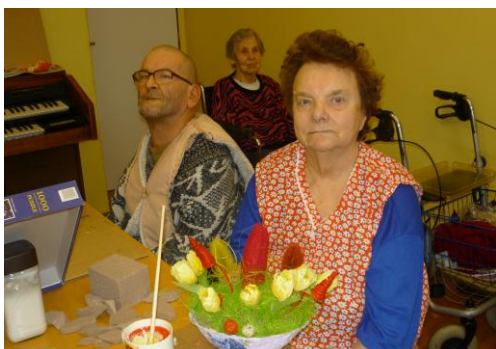
Dílna volnočasových aktivit a výrobky

také k dispozici HI-FI věž, kde je v rámci muzikoterapie klientům pouštěna hudba. Je zde k dispozici rychlovarná konvice, káva, čaje apod.