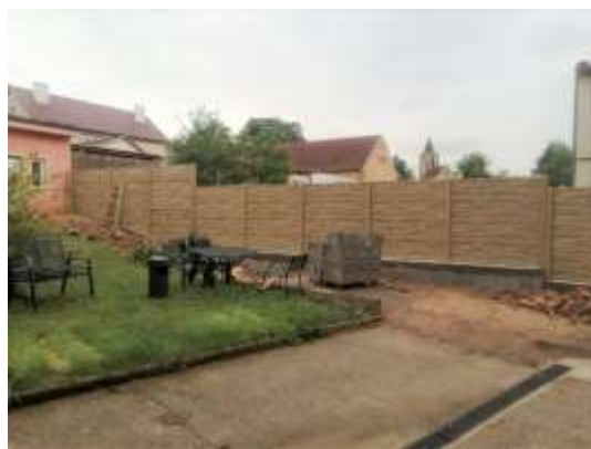
Obr.č.2- Nový plot

Díky možnosti zrušit průjezdová vrata na vedlejší pozemek mohl být vybudován dlouho odkládaný přístřešek pro sanitní vozy u bezbariérového vchodu, který zajistí našim klientům, doprovázejícím pracovníkům i posádkám sanitních vozů a rychlé záchranné služby komfort i při nepříznivém počasí. Nejprve bylo potřeba vyměnit povrch v tomto sektoru dvora. Původní více než 40 let starý povrch byl tvořen betonovými panely, které byly již polámané, drolily se a netvořily rovinu, což značně komplikovalo pohyb našich klientů, jejichž mobilita je omezena. Největší nebezpečí to znamenalo pro lidi s chodítky a vozíčkáře. Velkou pomocí pro nás byla spolupráce se zřizovatelem, protože výměna povrchu probíhala svépomocí.