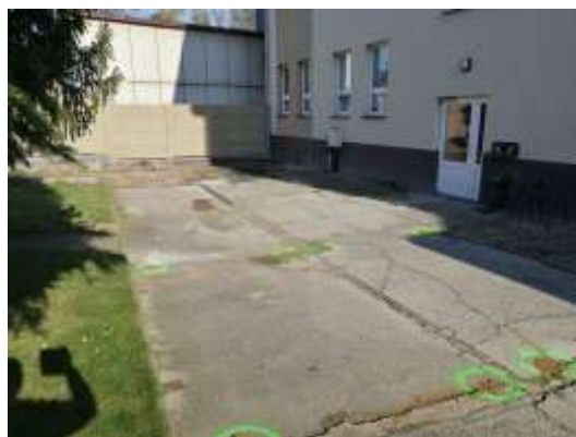
Obr.č.4- původní povrch