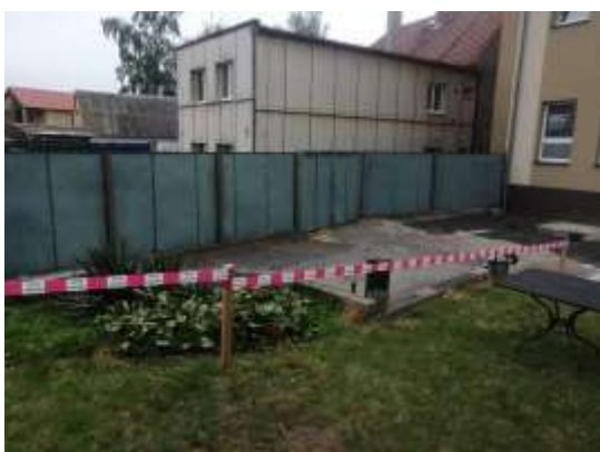
Obr.č.1- Původní plot

V roce 2020 byl vystavěn nový plot, na jehož stavbu byl materiál zakoupen v roce předchozím. Původní plechový plot s vraty byl v katastrofálním stavu, proto byla nutná jeho výměna. Po dohodě s městem a obyvateli vedlejšího objektu bylo domluveno, že budou zrušena původní vrata, která rozměrově nebyla širší než průjezd mezi naší a vedlejší budovou. Nový plot výrazně pomohl ke zlepšení celkového vzhledu dvora a přilehlé zahrady, jejíž postupnou revitalizaci plánujeme.