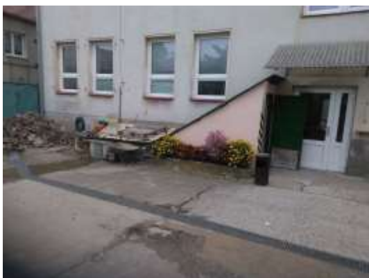
Obr.č.3- původní stav povrchu a bezbariérového vchodu

Díky možnosti zrušit průjezdová vrata na vedlejší pozemek mohl být vybudován dlouho odkládaný přístřešek pro sanitní vozy u bezbariérového vchodu, který zajistí našim klientům, doprovázejícím pracovníkům i posádkám sanitních vozů a rychlé záchranné služby komfort i při nepříznivém počasí. Nejprve bylo potřeba vyměnit povrch v tomto sektoru dvora. Původní více než 40 let starý povrch byl tvořen betonovými panely, které byly již polámané, drolily se a netvořily rovinu, což značně komplikovalo pohyb našich klientů, jejichž mobilita je omezena. Největší nebezpečí to znamenalo pro lidi s chodítky a vozíčkáře. Velkou pomocí pro nás byla spolupráce se zřizovatelem, protože výměna povrchu probíhala svépomocí.