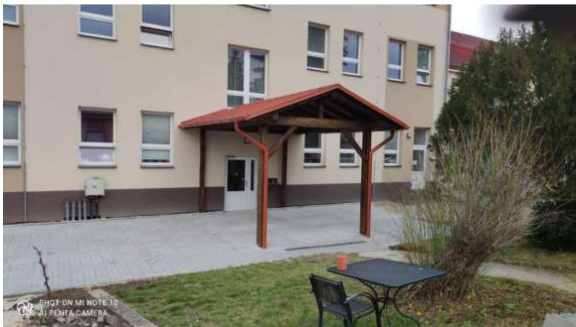
Obr.č.4- Nový přístřešek spolu s novým povrchem